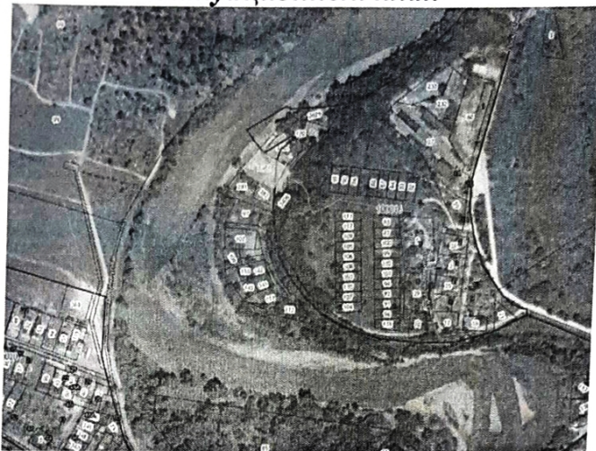
Фрагмент карты градостроительного зонирования МО «Каменноостское сельское поселение» от 28.12.2012 № 362, с учетом внесенных изменений от 30.09.2020 № 126-РС)