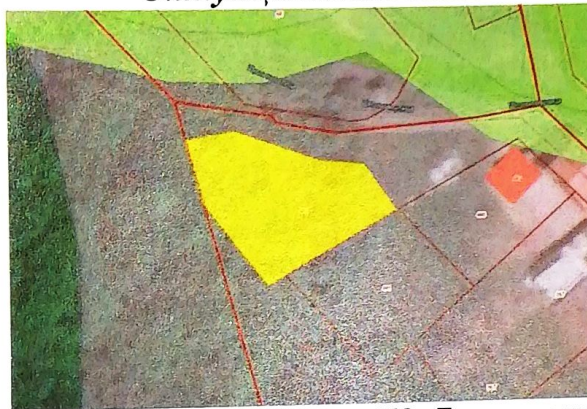
Фрагмент карты градостроительного зонирования МО «Тимирязевское сельское поселение» (утв. 14.12.2012г. №13, с учетом внесенных изменений от 30.09.2020 №123-РС)