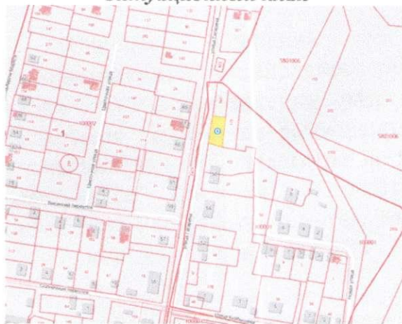
Фрагмент карты градостроительного зонирования МО «Каменноостровское сельское поселение» от 28.12.2012 № 362, с учетом внесенных изменений от 30.09.2020 № 126-РС)