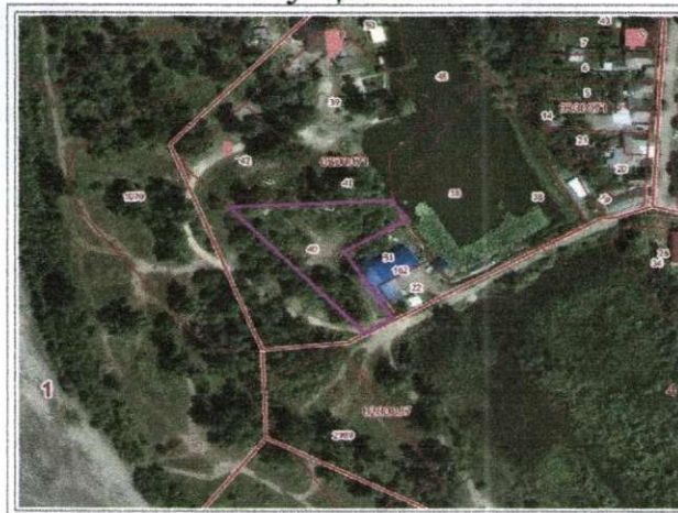
Фрагмент карты градостроительного зонирования МО «Тульское сельское поселение» (утв. 30.03.2012г. №400, с внесенными изменениями от 31.10.2019 №99-РС)