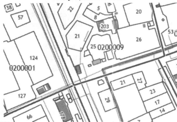
Фрагмент карты градостроительного зонирования МО «Тульское сельское поселение» (утв. 30.03.2012г. №400, с учетом внесенных изменений от 26.09.19 93-РС)