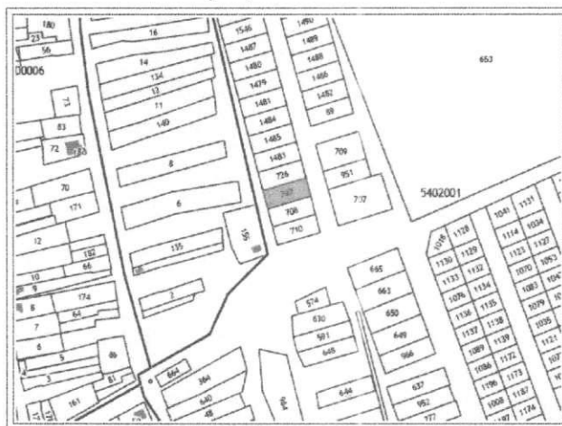
Фрагмент карты градостроительного зонирования МО «Кировское сельское поселение» (утв. 01.10.2012г. №148, с учетом внесенных изменений от 26.06.2019 №112-РС)