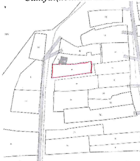
Фрагмент карты градостроительного зонирования МО «Тульское сельское поселение» (утв. 30.03.2012г. №400, с учетом внесенных изменений от 01.03.2023 № 16-ПЗЗУ)